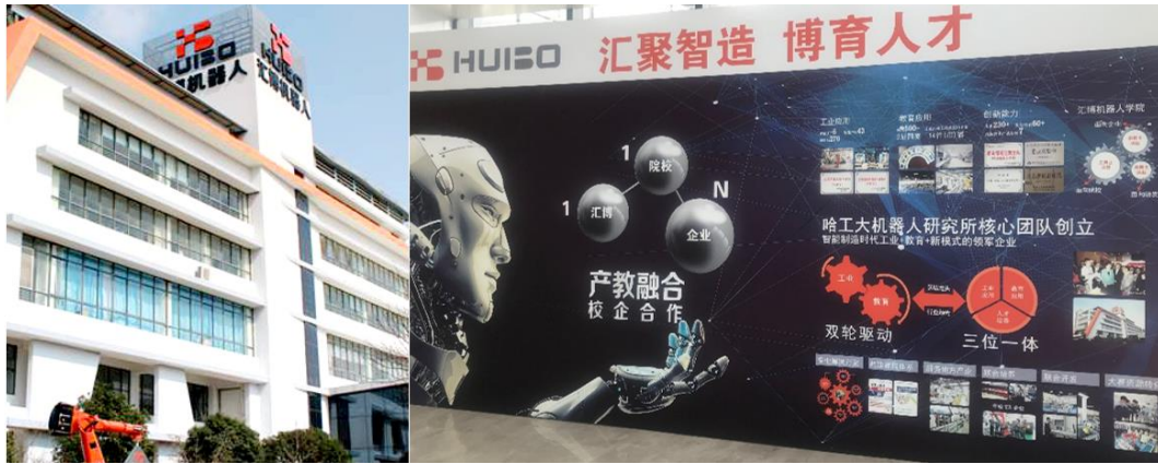
图1 江苏汇博机器人技术股份有限公司