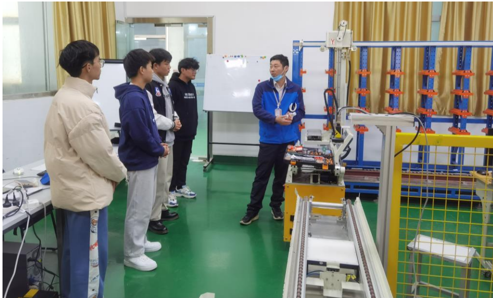
图4 企业兼职教师指导实训

程体系构建、专业课程改革提出了指导意见。与专业骨干教师进行技术技能提升的研讨，参与苏州工业职业技术学院“双导师制”学生培养。